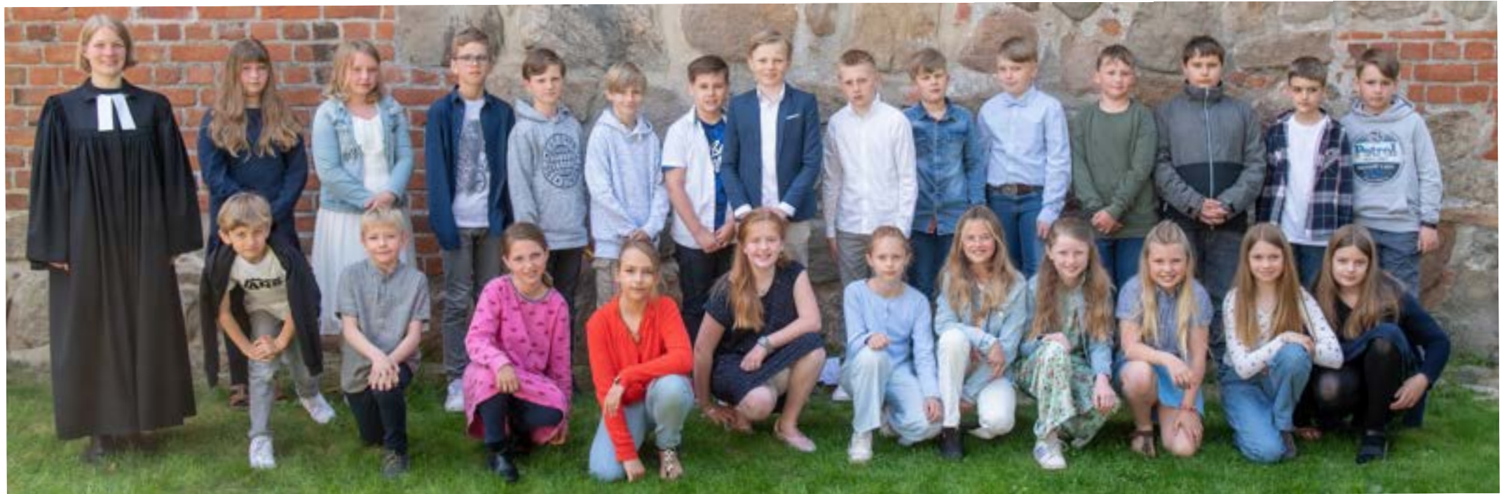
KU4 Verabschiedung Jevenstedt am 28.05.2023